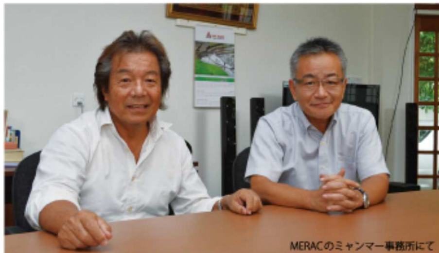
MERACのミャンマー事務所にて